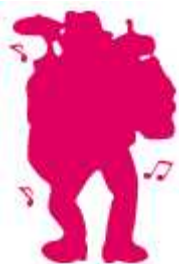
作芸人磨心(ワンマンオーケストラ)