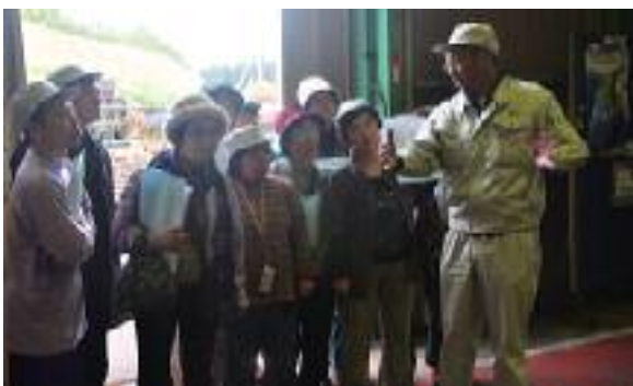
H21. 11. 13_八尾隊(産業観光コース)