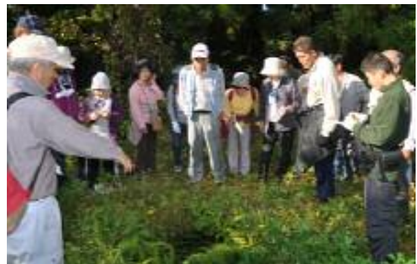
H21. 11. 08_東八尾隊(歴史探訪コース)