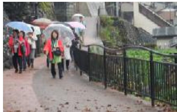
H21. 11. 14_八尾隊(まちなみ散策コース)