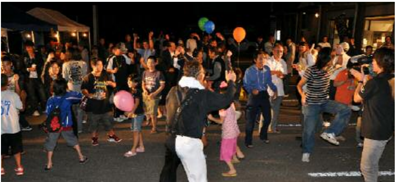
9月19日(土)に開催された「商工まつり」のフィナーレの様子

県下の商工会では「合併して従来の地域行事ができなくなった」という新聞記事が出て大きな反響を呼んだところですが、本会では合併を機会として、従来以上に内容も充実した各種の事業を実施して大きな成果を挙げることができました。